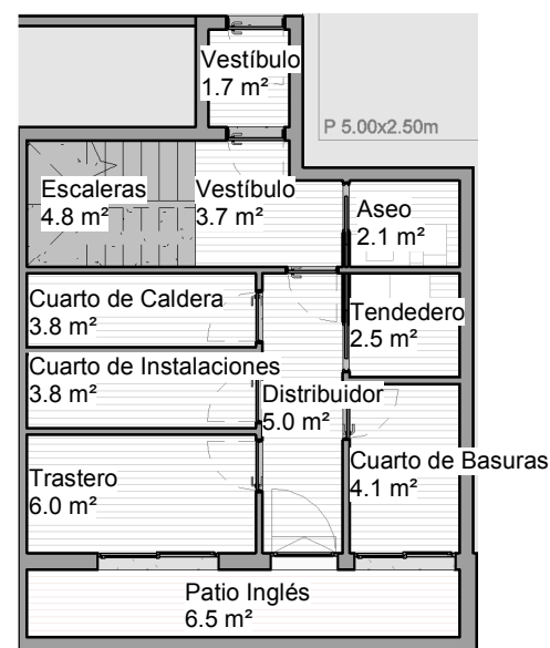
PLANTA SÓTANO 1 : 125