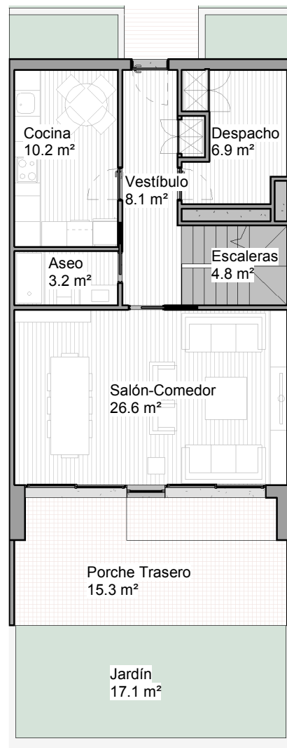
PLANTA BAJA 1 : 125

Los presentes planos, documentos, imágenes y superficies, carecen de carácter contractual, y son un avance del proyecto a desarrollar posteriormente. Por todo ello están sujetos a posibles modificaciones derivadas por la incorporación y ajuste de instalaciones, estructura, cumplimiento obligado de normativa y ordenanzas, o a criterio de los arquitectos redactores o DF del proyecto.