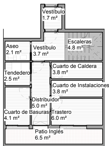
PLANTA SÓTANO 1 : 125