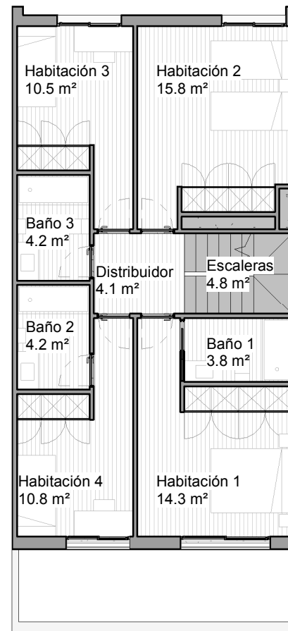
PLANTA PRIMERA 1 : 125