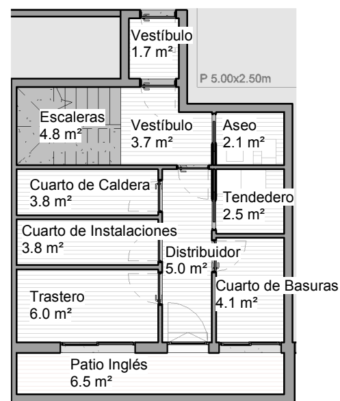
PLANTA SÓTANO 1 : 125